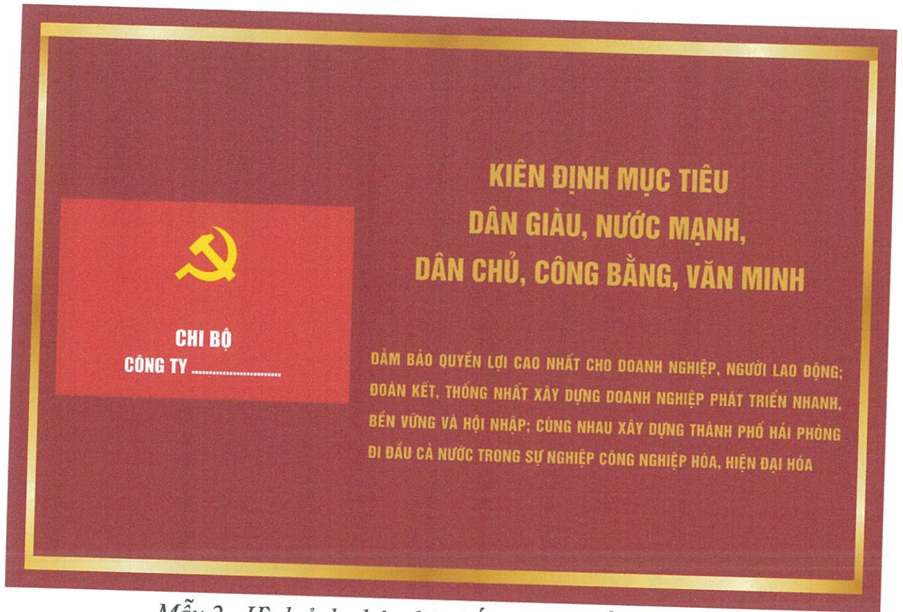
Mẫu 2 - Hình ảnh nhận diện bố trí theo chiều ngang