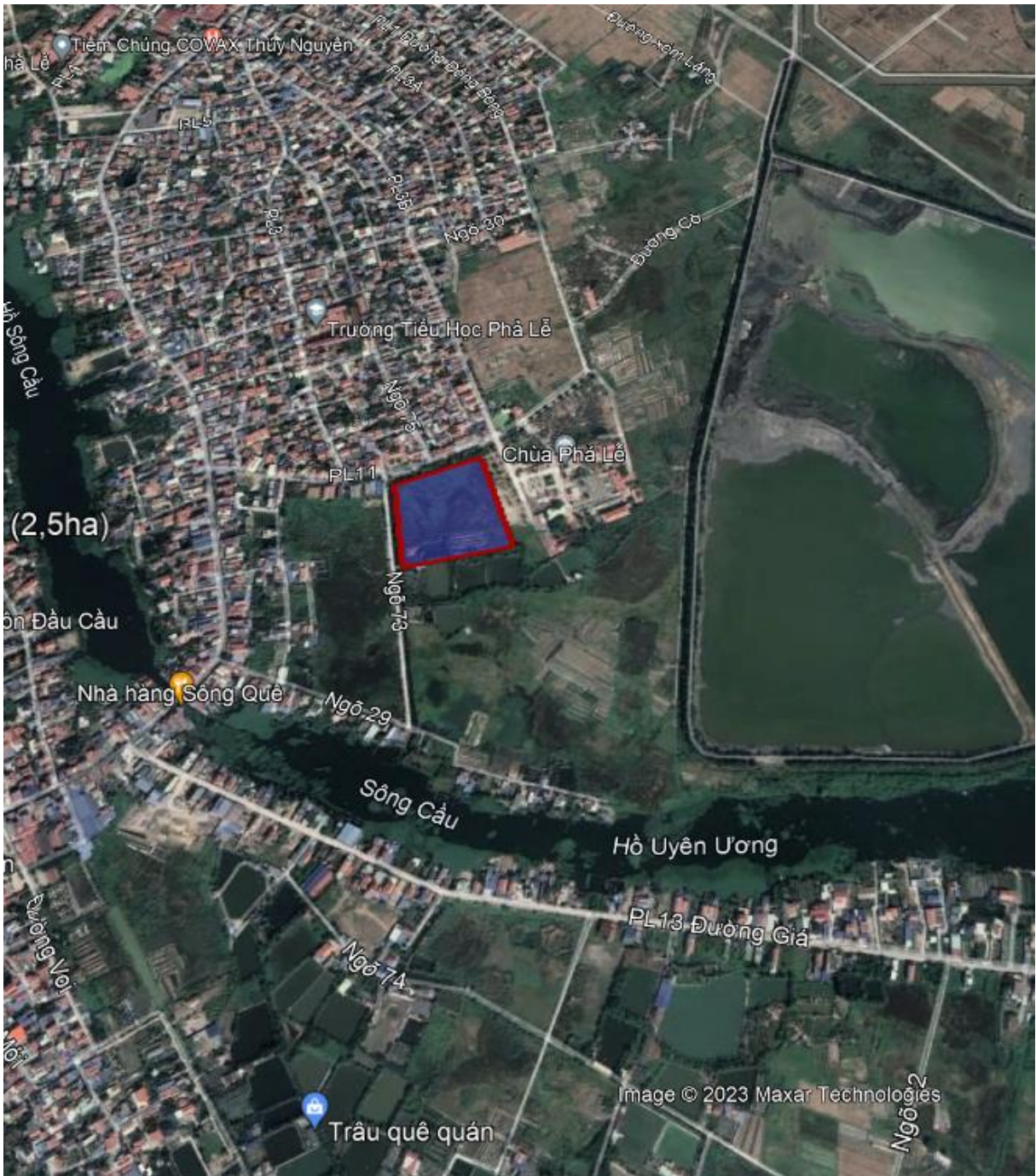
Hình 2. Vị trí thực hiện dự án