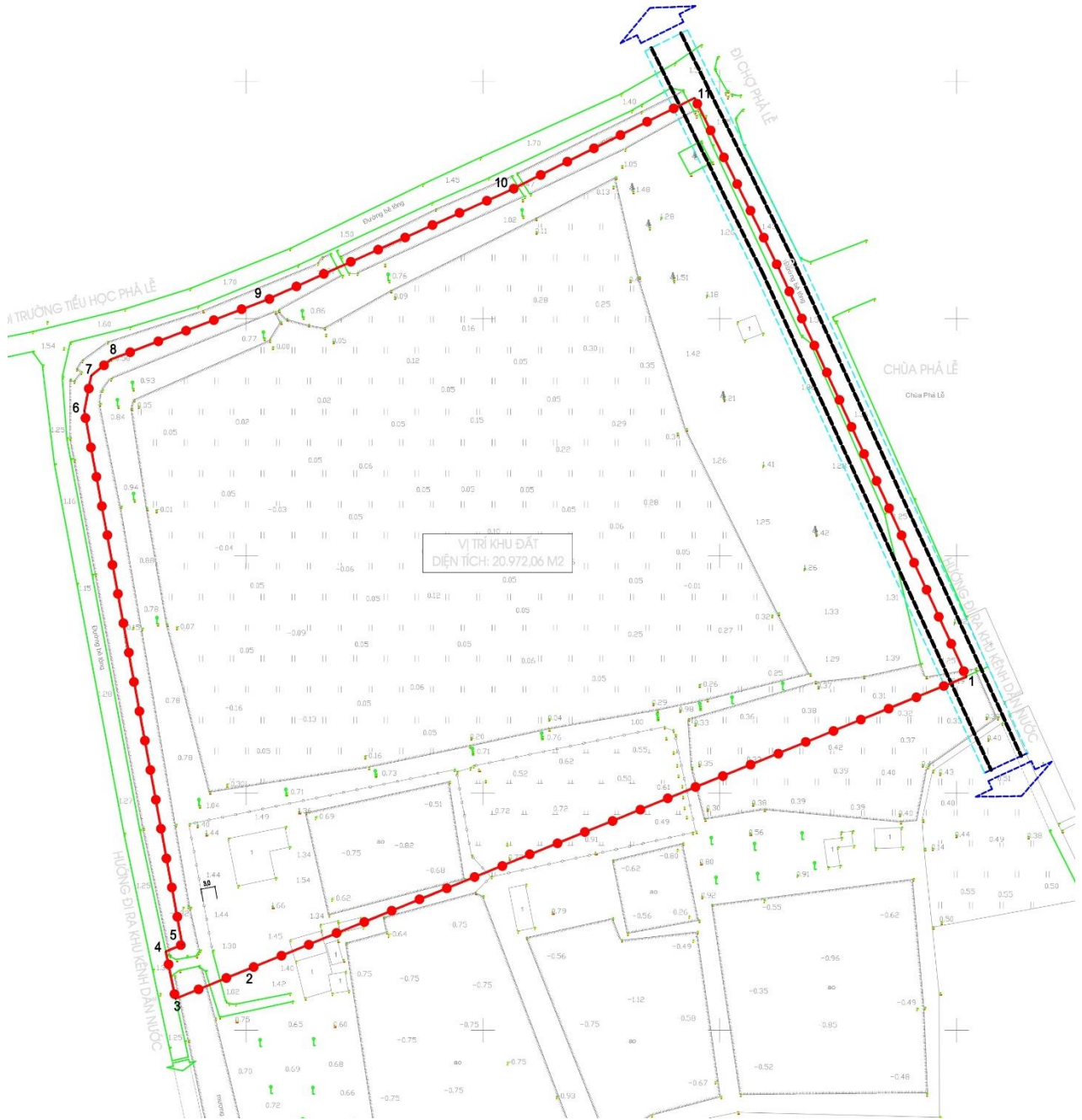
Hình 1. Các điểm mốc giới khu đất thực hiện dự án