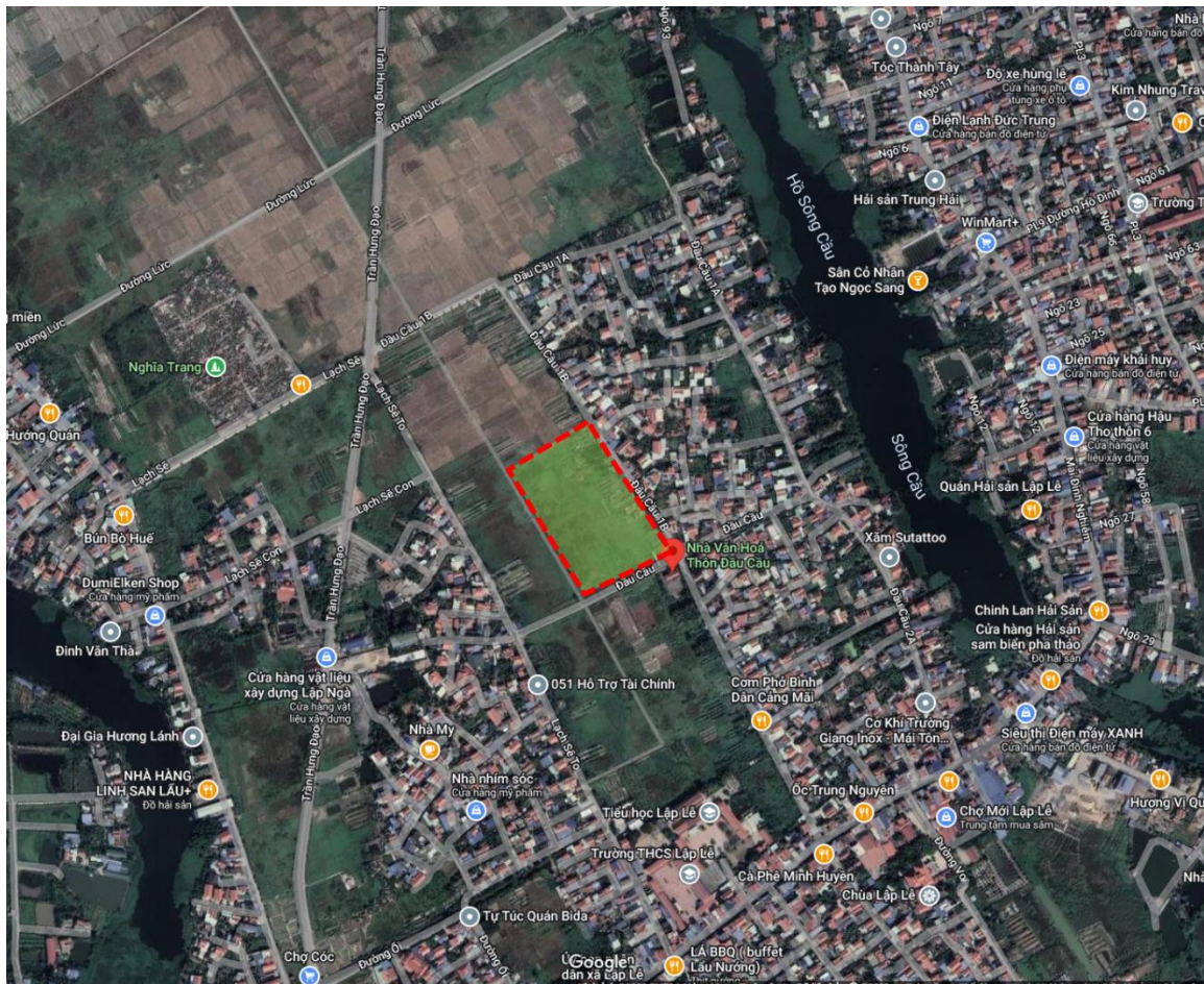
Hình 2. Vị trí thực hiện dự án