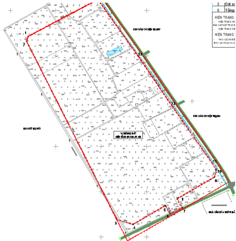
Hình 1. Các điểm mốc giới khu đất thực hiện dự án