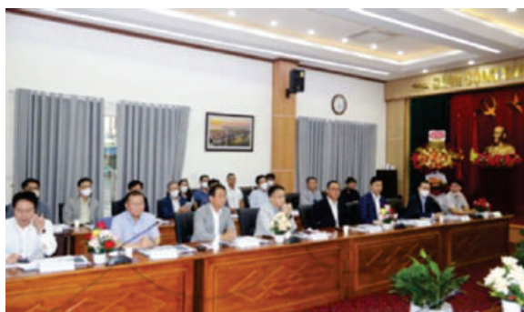
Các doanh nghiệp Hàn Quốc tại hội nghị xúc tiến đầu tư do Ban Quản lý Khu kinh tế Hải Phòng tổ chức

Tất cả những điều đó cho thấy, trong bất cứ