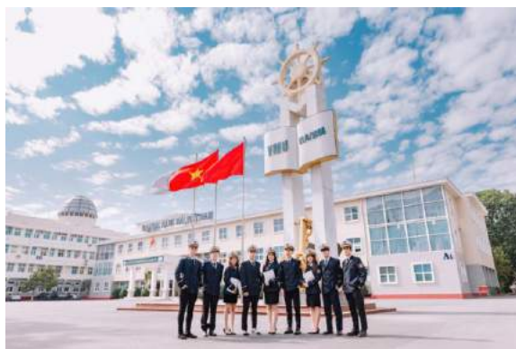
Đại học Hàng Hải Việt Nam - Một trong những cơ sở đào tạo nguồn nhân lực chất lượng cao hàng đầu tại Hải Phòng

Đối với các yêu cầu về ngoại ngữ của nguồn nhân lực, Hải Phòng đã có những kế hoạch mang tính dài hạn để đáp ứng những làn sóng đầu tư của các doanh nghiệp nước ngoài vào