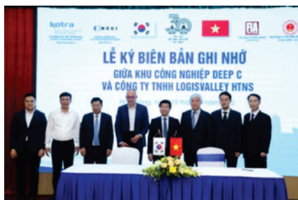
Nhiều thỏa thuận hợp tác đầu tư tại các KCN được ký kết

này, đoàn đã tới thăm nhà máy của Tập đoàn Saint Gobain; thăm cảng và khu công nghiệp Deep C. Các chuyến tham quan thực địa và cuộc hội thảo cung cấp cho các thành viên của đoàn bức tranh tổng thể và đầy đủ nhất về các cơ hội kinh doanh trong khu vực, từ đó tối ưu hóa tiềm năng phát triển của Pháp tại khu vực. Ông khẳng định, Việt Nam nói chung và Hải Phòng nói riêng là điểm đến rất hấp dẫn cho các nhà đầu tư, đặc biệt sau khi Hiệp định thương mại tự do EU – Việt Nam có hiệu lực. Ông nhấn mạnh sẽ tích cực là cầu nối, kết nối các doanh nghiệp cả hai chiều