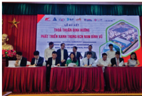
Lãnh đạo Ban Quản lý Khu kinh tế Hải Phòng chứng kiến ký kết thỏa thuận hợp tác chiến lược về phát triển năng lượng tái tạo tại KCN Nam Định Vũ