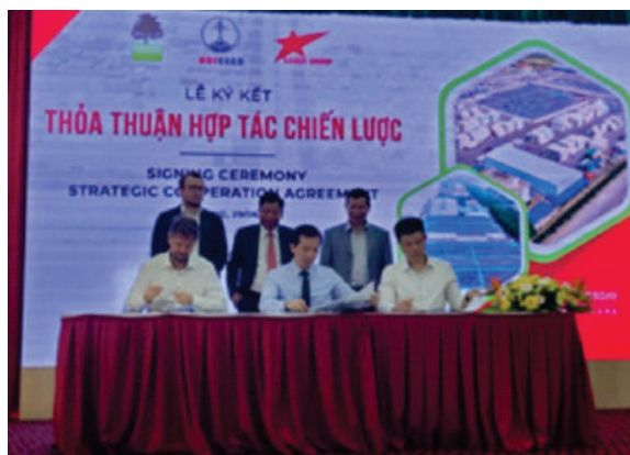
Ký kết thỏa thuận hợp tác phát triển năng lượng tái tạo tại KCN

Còn hội thảo và xúc tiến đầu tư "Năng lượng