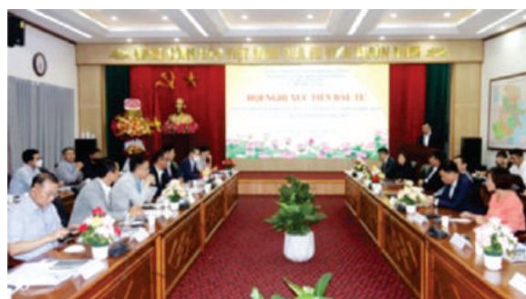
Hội nghị xúc tiến đầu tư với các doanh nghiệp phụ trợ Hàn Quốc

Điểm mới thứ hai là Ban Quản lý Khu kinh tế Hải Phòng đã tổ chức hội nghị theo hình thức trực tiếp và trực tuyến. Do đó, không chỉ đại biểu dự hội nghị mà nhiều doanh nghiệp đang ở các nơi khác cũng có thể tham gia, cùng giao lưu, tương